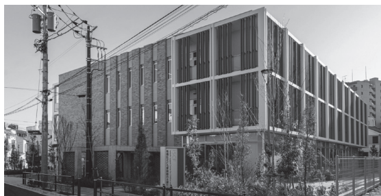
子ども家庭総合支援センター

▶ 4月から、子ども家庭総合支援センターを開設します。7月からは、政令の指定を受けて、児童相談所業務を開始します。区民のみなさんに最も身近な基礎的自治体のメリットを最大限に活かし、次世代を担う子どもたちが心豊かに成長できる環境づくりに取り組みます。