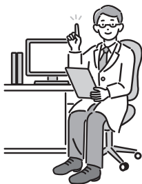
表1 医師によるもの忘れ相談

参照▶ 対象 =区内在住の65歳以上で、もの忘れで医療機関にかかっていない方※家族(区外在住を含む)も相談可▶ 定員 =各回1人(申込順)▶ 申込・問 =電話で、希望会場を担当するおとしより相談センター