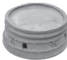
円面硯(四葉地区遺跡出土)