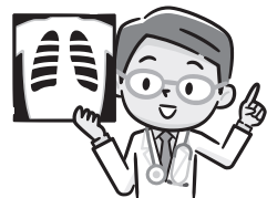
表3 胃・肺がん検診