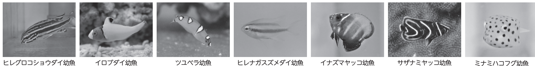
ヒレグロコショウダイ幼魚 イロブダイ幼魚 ツユベラ幼魚 ヒレナガスズメダイ幼魚 イナズマヤッコ幼魚 サザナミヤッコ幼魚 ミナミハコフグ幼魚