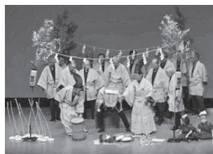
徳丸北野神社田遊び

▶とき=7月7日(木)11時~16時30分▶ところ=成増アクトホール▶出演=徳丸北野神社田遊び保存会ほか▶定員=230人(抽選)▶申込・問=6月30日(必着)まで、往復はがき・電子申請(区ホームページ参照)で、生涯学習課文化財係 ☎3579-2636※申込記入例参照