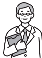
表2 医師によるもの忘れ相談

▶ とき・ところなど =表2参照 ▶ 対象 =区内在住の65歳以上で、もの忘れで医療機関にかかっていない方※家族(区外在住を含む)も相談可 ▶ 定員 =各回1人(申込順) ▶ 申込・問 =電話で、希望会場を担当するおとしより相談センター