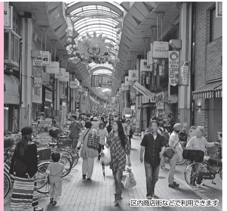
区内商店街などで利用できます