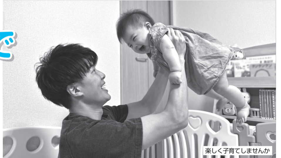
楽しく子育てしませんか

▶ とき = 10月10日(祝)10時～11時30分 ▶ ところ = 教育支援センター(区役所6階) ▶ 対象 = 区内在住のパートナー同士 ▶ 定員 = 8組※生後4か月～未就学児の保育あり(定員8人)