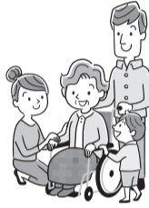
表 認知症の方を介護する家族のための交流会

▶ とき・ところなど(各1日制) ＝表参照 ▶ 内容 ＝交流・情報交換 ▶ 対象 ＝認知症の方を介護している家族 ※定員など詳しくは、お問い合わせください。▶ 申込・問 ＝電話で、おとしより保健福祉センター認知症施策推進係 ☎5970-1121