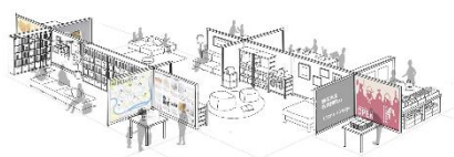
区民まつり「絵本のまちひろば」 デザイン参考イメージイラスト