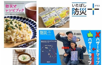
板橋防災プラスプロジェクト

「いたばし防災+（プラス）フェア」は、このプロジェクトの一環として、最新のデジタルツールを活用し、楽しんで参加できるコンテンツを豊富に用意しました。防災に対する意識が低くなりがちな若年層などをはじめとした幅広い層への働きかけを行い、地域の防災力の底上げにつなげていきます。