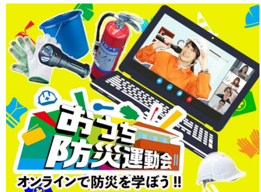
オンラインイベント イメージ