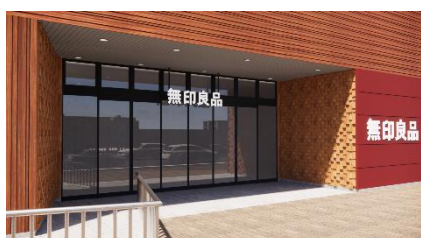
無印良品新店舗イメージ

※区の子育て支援の一環で、施設等にオムツ替えや授乳の場所の確保や、ミルク用のお湯の提供などを行うスペースを設置する取組。