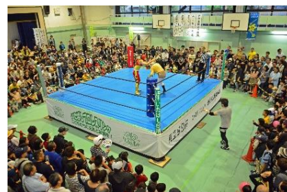
前回（令和元年度）の様子