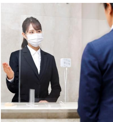
パーティション取付型会話補助システム イメージ

庁舎案内カウンターには、外国籍の方や聴覚に障がいのある方など、支援を必要とする多様な方々が訪れます。多くの方に寄り添った窓口サービスの実現に向け、英語や中国語、韓国語、ウクライナ語などを含む 16 言語のほか、手話通訳にも対応した多言語通訳システムを導入し、「おもてなしの心」でお迎えします。