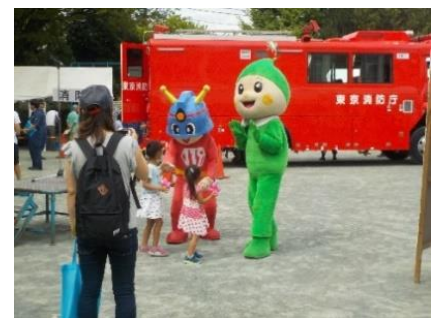
過去のイベントの様子 (令和元年度)