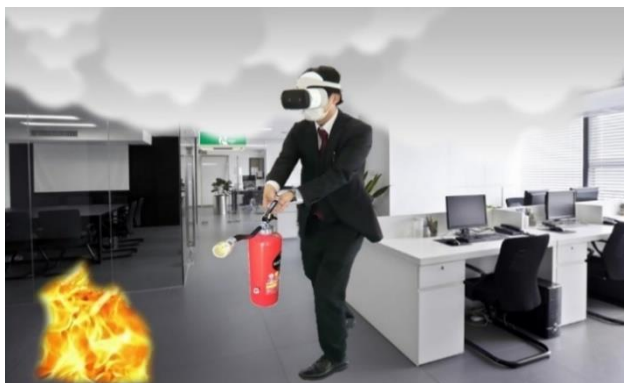
AR 機器体験 イメージ