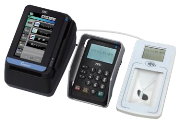
キャッシュレス決済システム イメージ