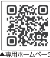
▲専用ホームページ

いたばしPayは、スマートフォン専用のアプリで、区内利用可能店舗でのお買い物の支払いに利用できる、区独自のデジタル地域通貨です。※利用方法・アプリのダウンロード方法など詳しくは、専用ホームページをご覧ください。※通信料がかかります。