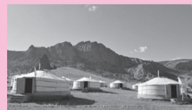
ゲル(モンゴル遊牧民の移動式住居)

1992年に、紙不足で困っていたモンゴル国へノート・鉛筆などを贈ったことをきっかけに、交流が始まりました。1996年に、モンゴル国文部省(現：文化省、教育科学省)と文化・教育交流協定を締結し、馬頭琴コンサート・ブフ大会(モンゴル相撲大会)・公式相互訪問などで、交流を続けています。