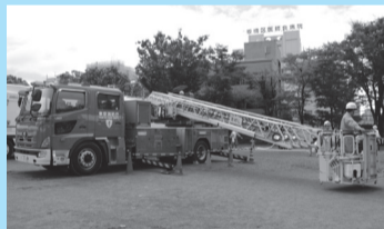
はしご車搭乗体験