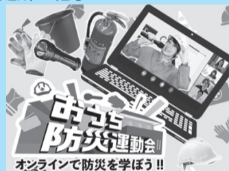
オンラインで防災を学ぼう!!