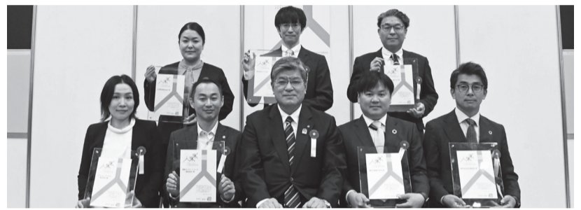
【受賞企業のみなさん】 エコール・クリオロ(株)(前列左端)、黒船イノベーションズ(株)(前列左から2人目)、恵友印刷(株)(前列右から2人目)、(株)志村製函所(前列右端)、日本興志(株)(後列左端)、(株)ルケオ(後列中央)、(有)八槻木工所(後列右端)

区では、「いたばし人と未来を創る会社賞」を新たに設立し、地域に根差し、人を育て、成長につながる努力をし続ける中小企業などを表彰しています。企業・地域の未来を創るために取り組んでいる先進的な企業を紹介します。