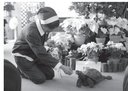
「ムっちゃん」クリスマス点灯式