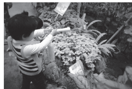
トワイライトジャングル探検