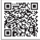
▲詳しくはこちらから

▶任期=4月から2年間▶選定=地域・年齢などの構成を考慮したうえで決定 ※3月下旬までに選定結果をお知らせします。▶申込書の配布場所=広聴広報課(区役所4階②窓口)・各地域センター・区ホームページ▶申込=1月25日(必着)まで、申込書を直接または郵送で、広聴広報課広聴係※区ホームページからも申込可※タウンモニター・eモニターの重複申込不可※謝礼・交通費などの支給はありません。※モニターで利用する機器・通信費は自己負担