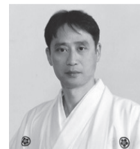
三代目若松若太夫

▶とき=1月21日(土)13時30分～16時▶ところ=成増アクトホール▶演目・出演 ●葛の葉…三代目若松若太夫(都指定無形文化財「芸能」保持者) ●卅三間堂棟由来…竹本綾之助・鶴澤津賀花(いずれも女流義太夫) ▶定員=450人(抽選)▶申込・問=1月12日(必着)まで、往復はがき・電子申請(区ホームページ参照)で、生涯学習課文化財係 ☎3579-2636※申込記入例参照