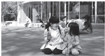
区制施行90周年を記念してインスタグラムで写真を募集