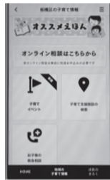
子育て情報・予防接種・オンライン相談などの検索・予約・管理機能を搭載