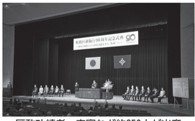
区政功績者・来賓など約850人が出席