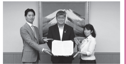
プラスチック資源の効率的な回収・再利用のために締結