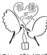
「板橋のいっぴん」ロゴマーク