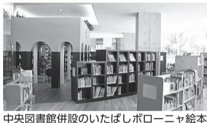
中央図書館併設のいたばしポローニャ絵本館では世界約70言語・3万冊の絵本を所蔵