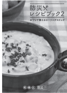
備蓄食材で手軽に作れるレシピを紹介