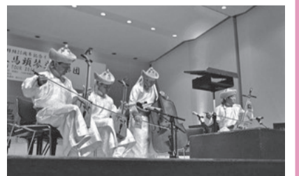
区制施行90周年と日本・モンゴル外交関係樹立50周年を記念し開催