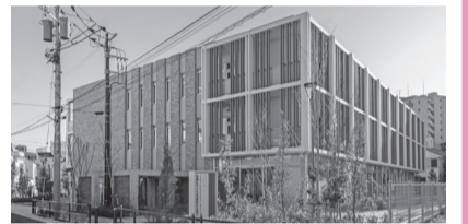
子育て機能の総合支援拠点