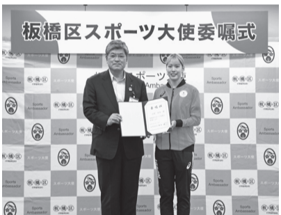
区の魅力発信とスポーツ振興のために活動