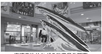
交流自治体などの物産品を販売