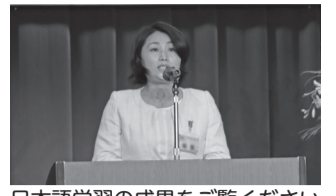
日本語学習の成果をご覧ください

▶とき=2月25日(土)14時～17時▶ところ=グリーンホール2階ホール▶内容=外国籍の方による日本・自国の文化などをテーマにしたスピーチなど▶定員=200人(先着順)※当日、直接会場へ。▶問=(公財)板橋区文化・国際交流財団(区役所内)☎3579-2015