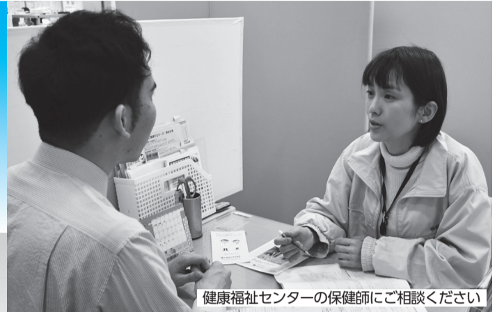
健康福祉センターの保健師にご相談ください