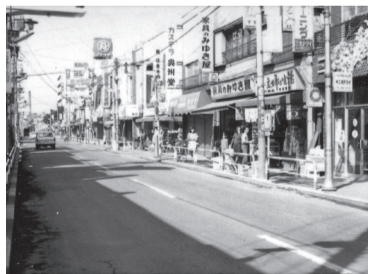
昭和47年の志村銀座商店街