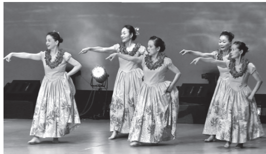
日頃の練習の成果を発表してみませんか

▶ とき = 8月5日(土)・6日(日)、各1日制、10時～16時30分※説明会(6月9日(金)18時30分から、区立文化会館大会議室)あり ▶ ところ = 区立文化会館大ホール ▶ 内容 = ダンス・音楽などの発表 ※出演時間は10分 ▶ 対象 = 出演者の半数以上が区内在住・在勤・在学中、10人以上の団体 ▶ 募集数 = 各日30団体(抽選) ▶ 費用 = 1団体3万円 ▶ 申込・問 = 4月14日(消印有効)まで、はがきで、(公財)板橋区文化・国際交流財団(〒173-0014大山東町51-1)※申込記入例(8面)の項目と団体名、出演希望日(どちらでもよい場合は優先順位)、出演ジャンル(演奏・歌・ダンスなど)、出演人数、Eメールアドレスを明記。※同財団ホームページからも申込可