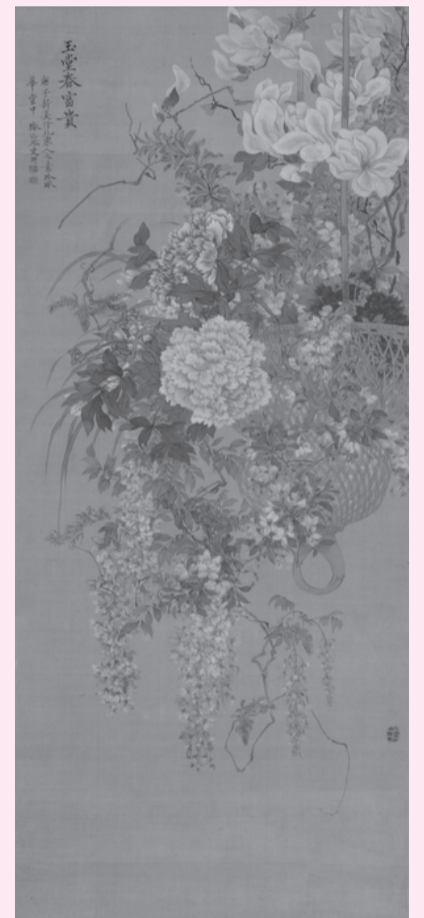
「玉堂富貴・遊蝶・藻魚図」のうち中幅 (泉屋博古館所蔵)・前期展示