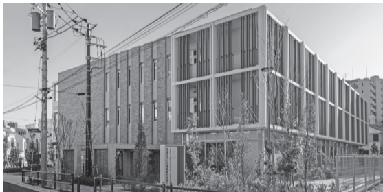
子ども家庭総合支援センター

▶子ども家庭総合支援センターでは、地域・団体と連携して定期的な家庭訪問を行い、支援対象となる子どもの見守りを強化します。