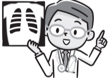
表1 胃・肺がん検診

※手話通訳あり。希望する場合は、手話通訳希望と明記し、受診希望日の21日前までにお申し込みください。 ▶ 問 = 健康推進課成人健診係 ☎3579-2312