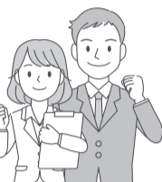
表 特別区職員(I類)採用試験

土木造園(土木)・土木造園(造園)・建築・機械・電気の1次試験は、教養試験・論文などが廃止され、専門試験のみになります。また、一般方式・新方式の区別がなくなり、試験内容が統一されます。