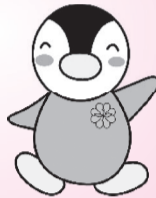
東京都民生委員・児童委員 イメージキャラクター 「ミンジー」

民生委員・児童委員は、援助を必要とする方の様々な相談に応じ、区・関係機関への橋渡しを行っています。