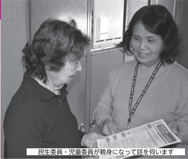
民生委員・児童委員が親身になって話を伺います