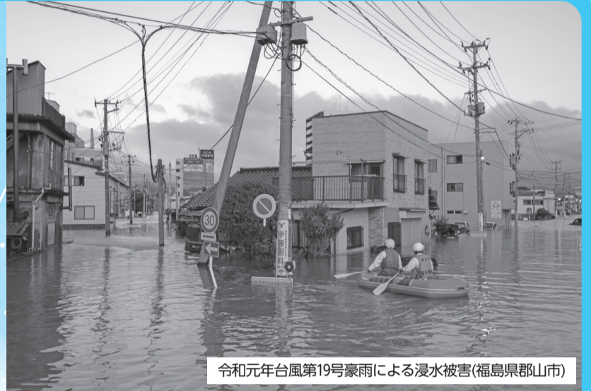
令和元年台風第19号豪雨による浸水被害(福島県郡山市)

梅雨・台風など雨の多い季節を迎えます。近年は、局地的・短時間に多量の雨が降る集中豪雨が増えており、河川の氾濫や道路冠水、浸水被害も発生しています。水害を防ぐため、区民のみなさんができる対策と、区の取組を紹介します。