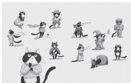
ロレンツォ・サンジョ(イタリア) 「物語のすごい力」