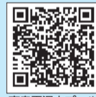
高島平温水プール