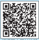
板橋区立屋外施設