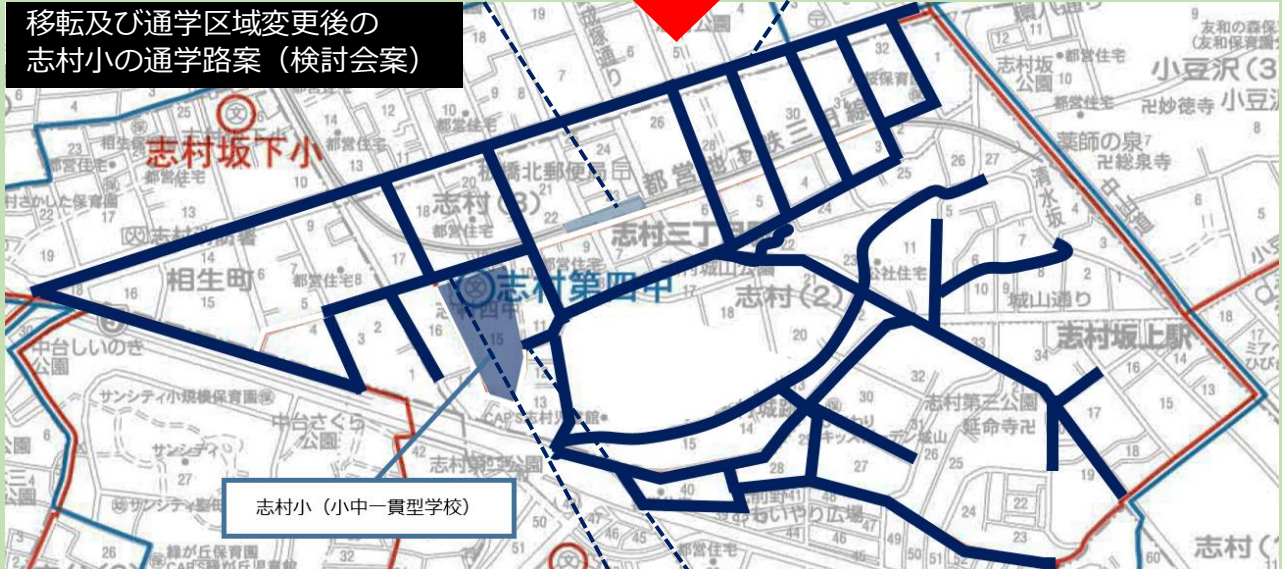
移転及び通学区域変更後の志村小の通学路案（検討会案）