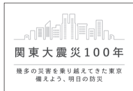
関東大震災復興100年ロゴ(東京都作成)