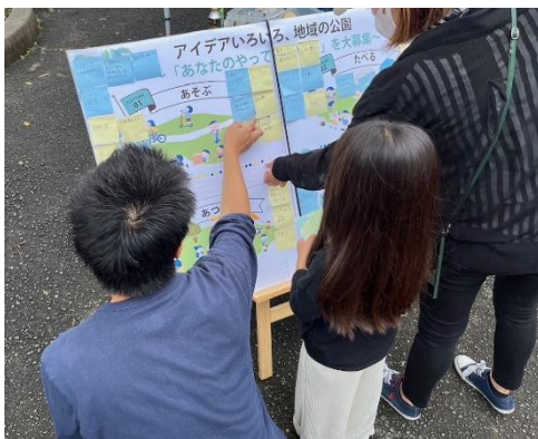
【公園投票板を用いたヒアリング】

「地域住民及び利用者」と「板橋第十小学校 5 年生」を対象にそれぞれ実施しました。「自分の住む地域をどのようにしていきたいか、それを踏まえてどういう公園にしたいか」を話し合い、出された意見はグラフィックレコーディングの手法を用いて可視化しました。