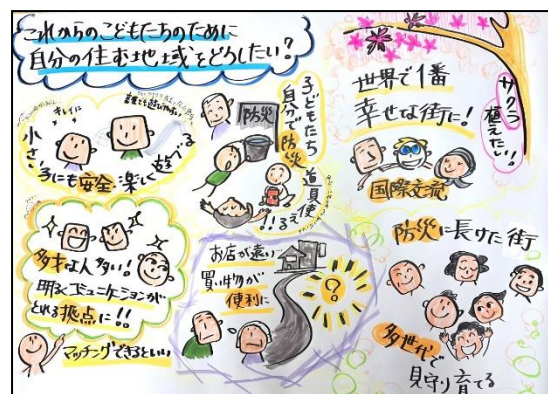
【ワークショップでの意見】