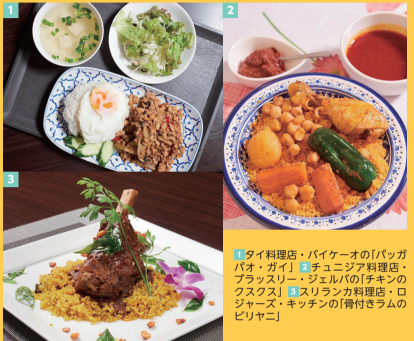
1 タイ料理店・バイケーオの「パッガバオ・ガイ」 2 チュニジア料理店・ブラッスリー・ジェルバの「チキンのクスクス」 3 スリランカ料理店・ロジャーズ・キッチン「骨付きラムのピリヤニ」