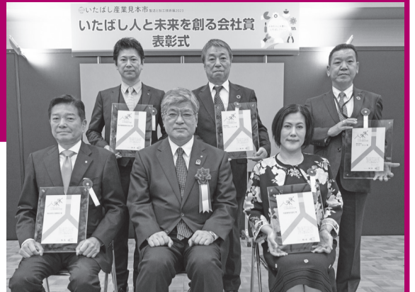
【受賞企業のみなさん】 (株)工藤商店(前列左端)、司産業(前列右端)、森本鐵鋼産業(後列左端)、(株)フォーラム・ジェイ(後列中央)、(株)ヤマテ・サイン(後列右端)