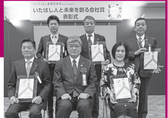
【受賞企業のみなさん】 株工藤商店(前列左端)、司産業株(前列右端)、森本鐵鋼産業株(後列左端)、株フォーラム・ジェイ(後列中央)、株ヤマテ・サイン(後列右端)