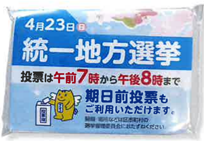
▲ ポケットティッシュ