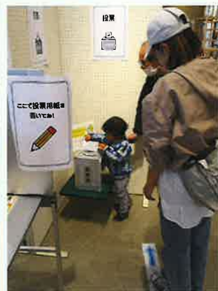
▲ 好きなお菓子を選んで投票体験