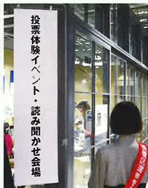
▲ 投票体験・読み聞かせ会場入口

今年も選挙が予定されていて、 そこでも子供たちを対象としたイベントを計画しています！