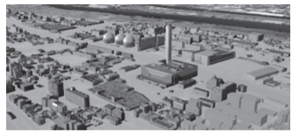
水害再現イメージ