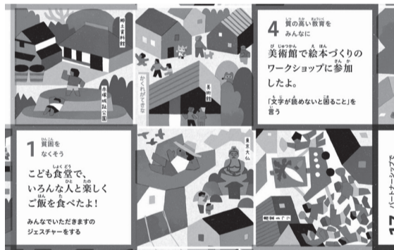
「いたばしさんぽ」盤面イメージ