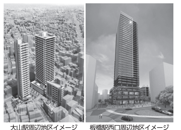
大山駅周辺地区イメージ