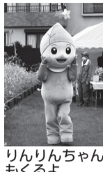
りんりんちゃんもくるよ

※雨天・参加団体の都合により、変更・中止になる場合があります。※定員の明示のないものは、材料が無くなり次第終了。